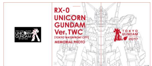
写真台紙イメージ